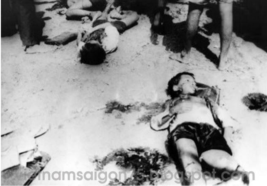
Viet cong 82mm mortar attack on Cai Lay Elementary Community School; At 14:55 hours on 9 March 1974. Killed 32 school children, and wounded 43 others