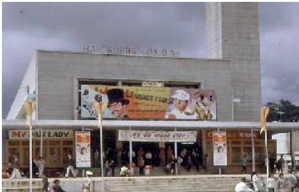
Rạp Ciné Hòa Bình còn có tên là hội trường Hòa Bình

Trong tháng 5 này có ngày “Mother’ Day”. Mình xin chúc các chị nhận được nhiều điều vui từ các con của mình.