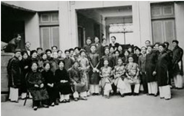
Cư dân ấp Hà Đông (Đà Lạt) những năm 1940

dong-da-lat-tong-doc-hoang-trong-phu-co-vai-tro-nhu-the-nao