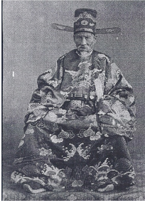
Phan Thanh Giản (1796-1867)