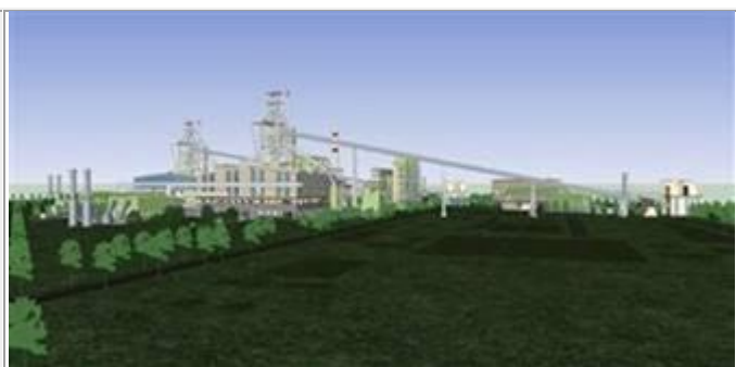
Hình 3: Thiết kế 3D của lò cao tại nhà máy thép FHS