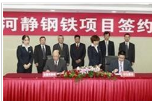
Hình 2: Lễ ký kết hợp đồng EPC giữa FHS và CISDI (10/10/2012)

Như chúng ta đã biết, EPC là một loại hợp đồng theo đó nhà thầu nhận tất cả các khâu: từ thiết kế kỹ thuật (engineering), mua sắm trang bị (procurement) cho đến xây dựng (construction). Bản tin này cũng nói rõ: CISDI sẽ bảo đảm cung cấp các lò cao và lò nung lại theo phương thức chìa khóa trao tay (turnkey).