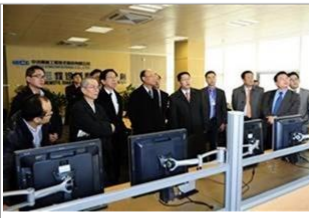
Hình 5: Phái đoàn của Formosa Hà Tĩnh đến thăm CISDI - tháng 2/2012

Những dẫn chứng trên đây cho thấy hai bên đã tìm hiểu nhau rất kỹ trước khi ký kết hợp đồng chính thức. Chính vì vậy mà chỉ hơn một tháng sau ngày ký kết chính thức, CISDI đã có chuyến hàng đầu tiên bằng đường tàu biển - liên quan đến các thiết bị và nguyên vật liệu để xây dựng